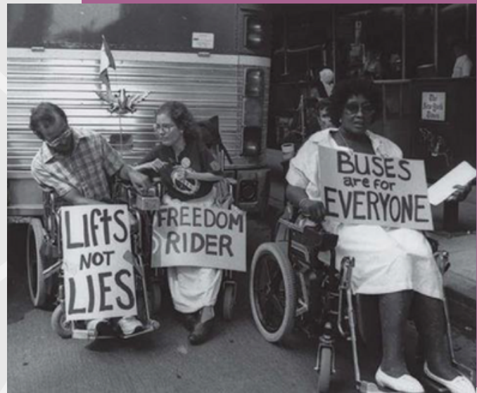
Protesta del Movimiento por los Derechos de las Personas con Discapacidad por la Ley de Rehabilitación de 1973